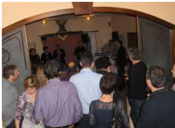
Un momento di attenzione durante la Bicchierata ; il Presidente saluta i presenti e apre ufficialmente la serata.