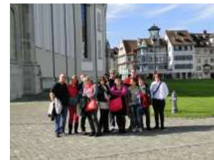
San Gallo, ore 11:30 – Visitata l'abazia e la sua splendida biblioteca la giornata è entrata nel vivo.