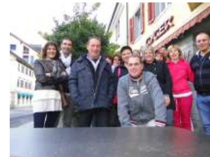
Thusis, ore 9:00 – Dopo colazione pronti per riprendere il viaggio.

L'appuntamento con la gita fuori porta è quindi già garantito per il prossimo autunno, con una nuova interessate meta e nuovi coetanei a bordo.