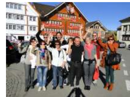
Appenzello, ore 15:15 – E dopo aver mangiato, mangiato e ben bevuto, non poteva mancare una vera "Landsgemeinde" in stile locale.